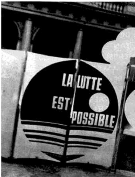
(LA LUCHA ES POSIBLE)

LA CRISIS GENERAL DE LOS VIEJOS APARATOS SINDICALES Y DE LAS BUROCRACIAS IZQUIERDISTAS SE HACÍA SENTIR POR TODAS PARTES PERO, SOBRE TODO, EN EL MEDIO ESTUDIANTIL, DONDE LA MÁS SÓRDIDA ABNEGACIÓN POR LAS IDEOLOGÍAS DESLUCIDAS Y LA AMBICIÓN MÁS IRREAL SE HABÍAN CONVERTIDO HACÍA TIEMPO EN EL ÚNICO RESORTE. EL ÚLTIMO CUADRO DE PROFESIONALES QUE ELIGIERON NUESTROS HÉROES NO TENÍA SIQUIERA LA EXCUSA DE UNA MISTIFICACIÓN. DEPOSITARON TODAS SUS ESPERANZAS DE RENOVACIÓN EN UN GRUPO QUE NO OCULTABA SUS INTENCIONES DE BARRER DE UNA VEZ POR TODAS Y LO MÁS RÁPIDO POSIBLE ESA MILITANCIA ARCAICA